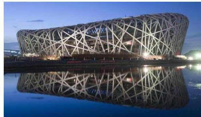
2008 奥运会主场馆.鸟巢